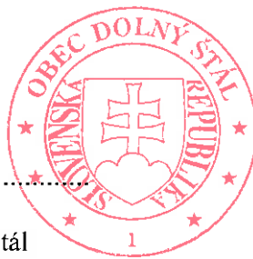
Tomáš Horváth starosta Obce Dolný Štál