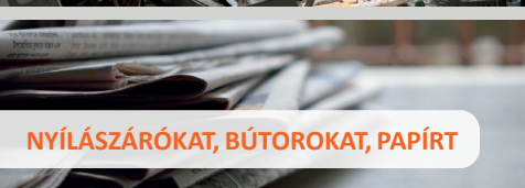
NYÍLÁSZÁRÓKAT, BÚTOROKAT, PAPIRT